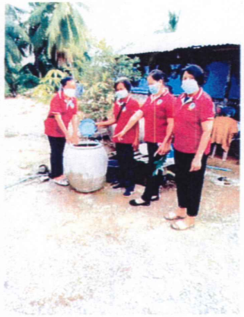
กิจกรรมรณรงค์กำจัดลูกน้ำยุงลาย