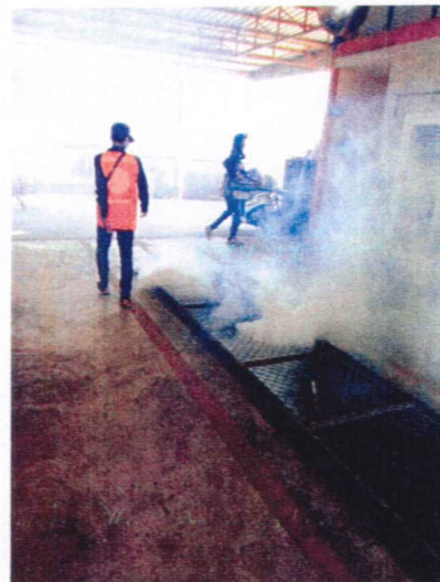
กิจกรรมพ่นหมอกควัน